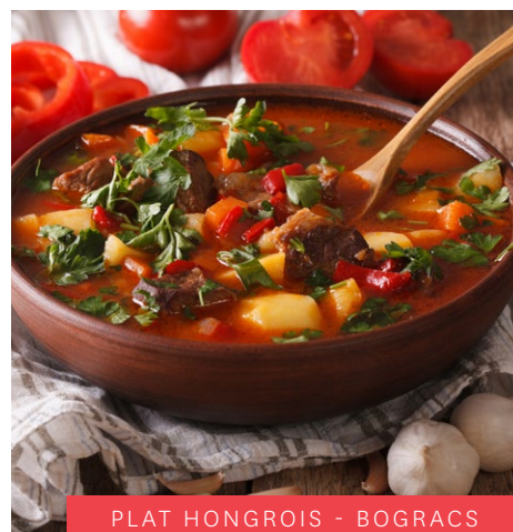
PLAT HONGROIS - BOGRACS