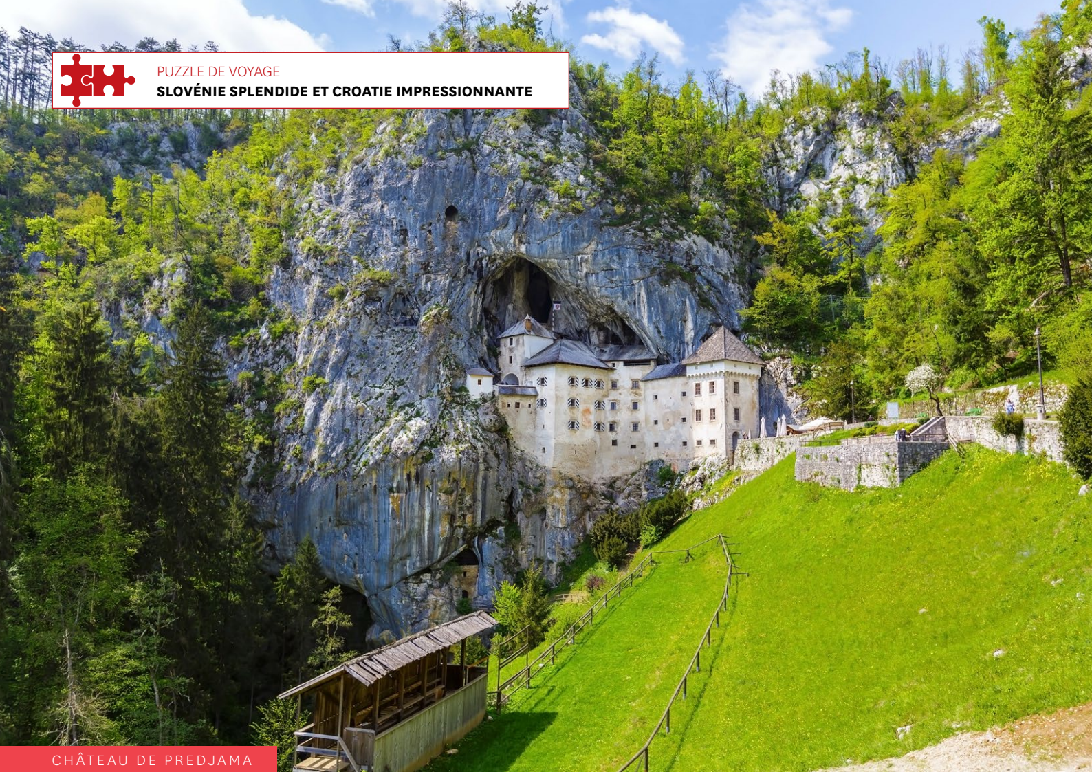
CHÂTEAU DE PREDJAMA